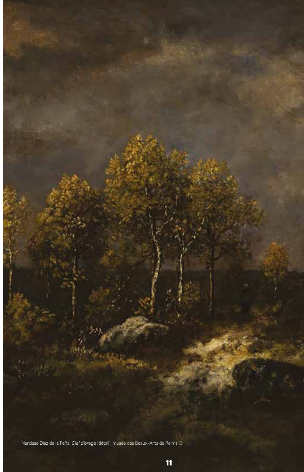
Narcisse Diaz de la Peña, Ciel d'orage [détail], musée des Beaux-Arts de Reims ©

Avant toute exposition, le pastel va devoir être restauré car il est en mauvais état, présentant notamment des moisissures. À partir du printemps, il pourra être exposé quelques mois sur le mur d'actualité des collections du musée, avant de regagner des réserves pour trois ans minimum afin de le préserver des méfaits de la lumière.