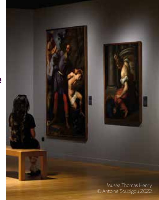
Musée Thomas Henry

Le musée doit son remarquable ensemble de peintures et de sculptures à un homme, Thomas Henry (1766-1836). Né à Cherbourg, Thomas Henry fut l'un des plus grands marchands d'art parisien du début du XIX e siècle. Entre 1831 et 1835, il donna 164 peintures et sculptures à sa ville natale, afin d'y «allumer le flambeau des arts». Cette donation constitue le fonds premier du musée.