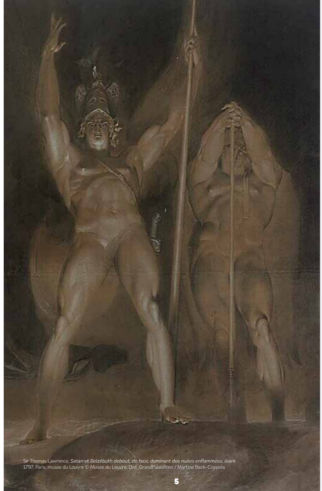
Sir Thomas Lawrence, Satan et Belzébuth debout, de face, dominant des nuées enflammées , avant 1797, Paris, musée du Louvre

L'exposition réunira des œuvres d'artistes majeurs du XIX e siècle, qui se sont emparés de la thématique diabolique : William Blake, Eugène Delacroix, Odilon Redon ou encore Félicien Rops, prêtées par des institutions françaises, britanniques et belges. L'exposition montrera comment, à travers ses représentations littéraires, picturales et graphiques, le diable concentre les désirs de révolte contre les contraintes sociales et les croyances conservatrices. Désirs portés par les artistes attachés à la défense de la pensée individualiste. En cela, Satan apparaît comme une projection de l'image de l'artiste et de son rôle dans la société.