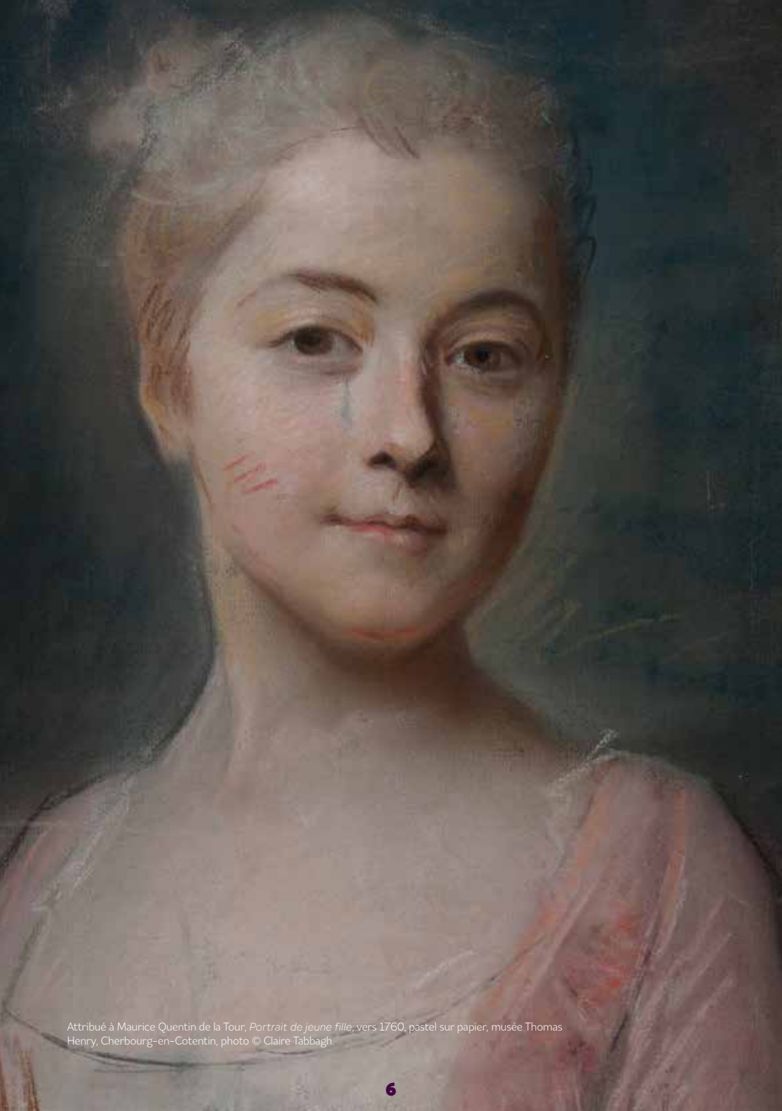
Attribué à Maurice Quentin de la Tour, Portrait de jeune fille , vers 1760, pastel sur papier, musée Thomas Henry, Cherbourg-en-Cotentin, photo © Claire Tabbagh.