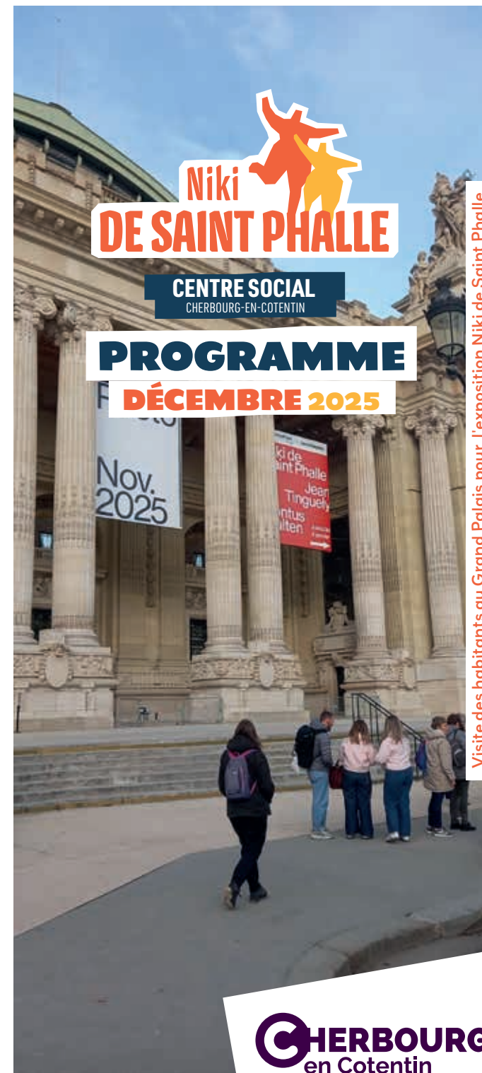
Visite des habitants au Grand Palais pour l'exposition Niki de Saint Phalle