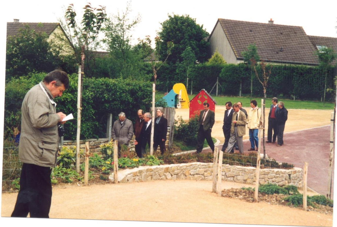
1, 2 et 3/ Inauguration du jardin public à la Glacerie le 28 mai 1994, Revue de presse fonds non-coté, La Glacerie