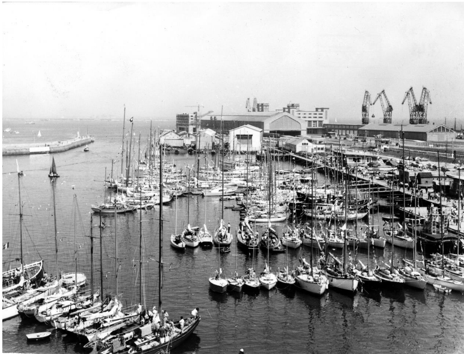
Bibliothèque Jacques Prévert, fonds des cartes postales, cote CHBG736. Vue générale de l'avant-port et de la gare maritime, prise pendant le rassemblement de Yachts, régates de Pentecôte [1960].

1960 : Toujours des régates, mais le Comité de Tourlaville s'inquiète des coûts, de l'organisation et de l'affaiblissement de l'intérêt populaire.