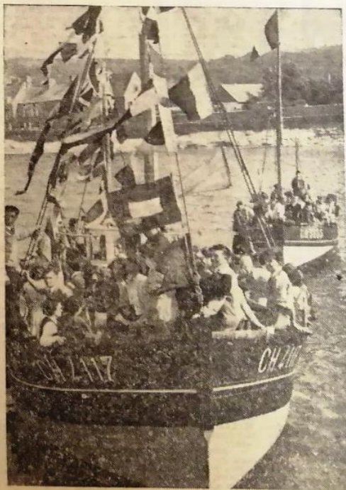
Le cordier « Roche-Bleue », armement Gaudry, prend la mer avec un chargement complet de promeneurs.