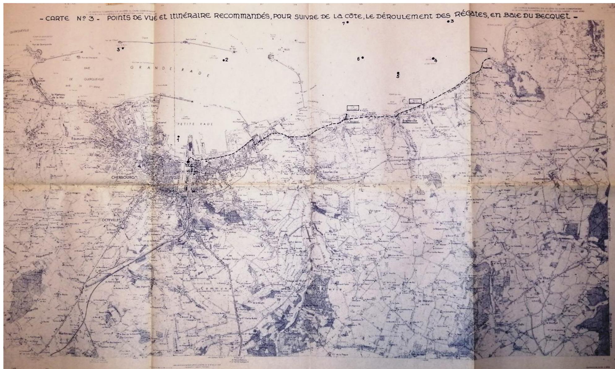
Archives municipales de Cherbourg-en-Cotentin, TOU-1154, Fêtes : organisation des Régates du Becquet (1961)