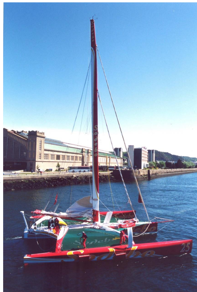
Archives municipales, fonds non classé de la direction de la communication, course Challenge Mondial Assistance (2003). Arrivée de l'équipe SODEBO, accompagné par le bateau du port de plaisance, le maire Bernard Cazeneuve, piloté par Jacky Huteau.

Voyages dans le Temps #01, août 2021, site internet de la ville de Cherbourg-en-Cotentin, page les archives municipales