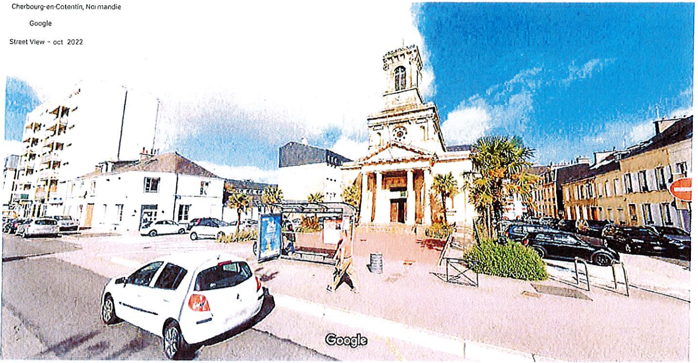
Date de l'image : oct 2022