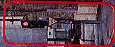
Poteau de feu à changer