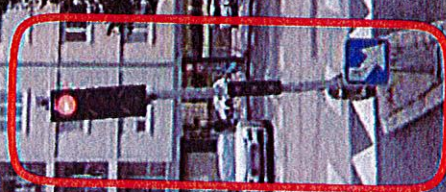
Poteau de feu à changer