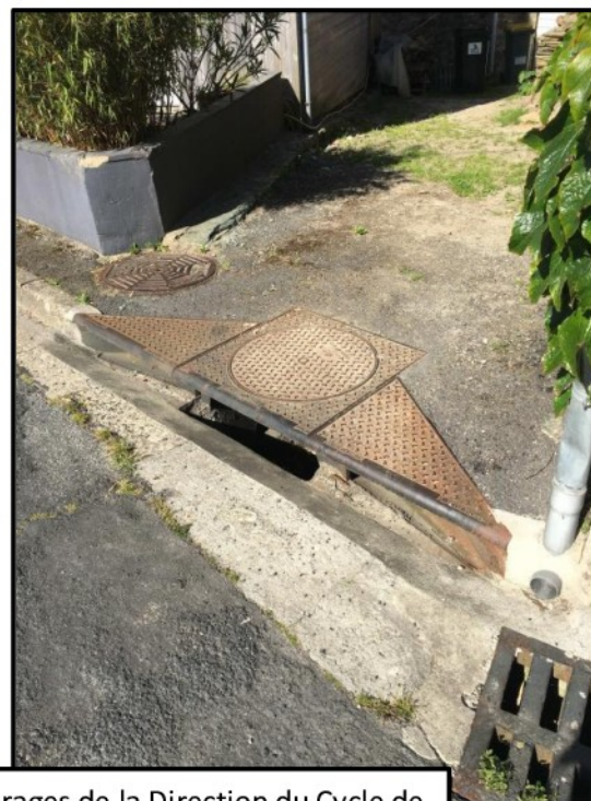
Ouvrages de la Direction du Cycle de l'Eau de la Communauté d'agglomération du Cotentin