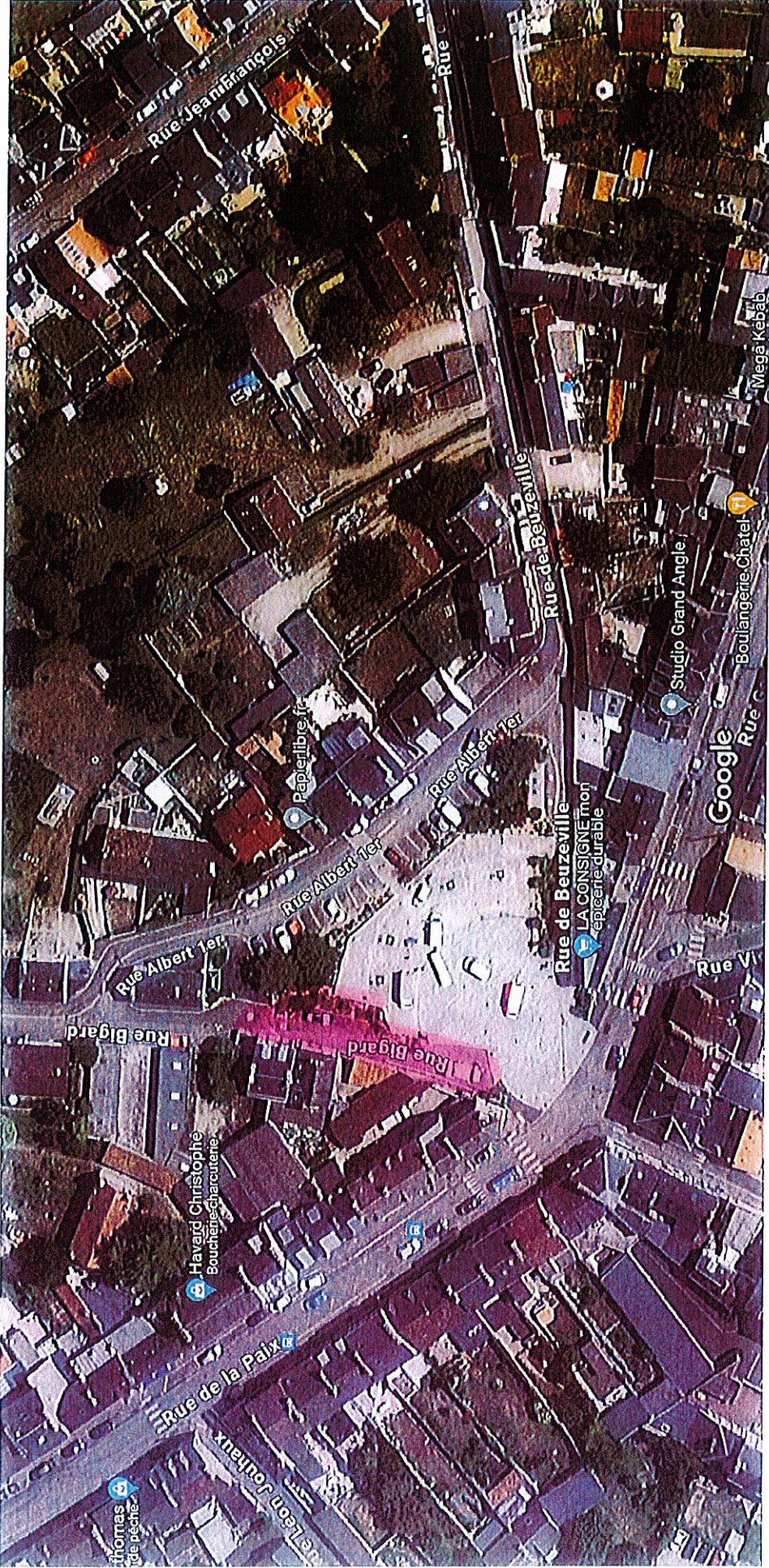
Images ©2024 Google, Images ©2024 CNES / Airbus, Maxar Technologies, Données cartographiques ©2024 20 m

Mapte Base + interdiction de stationnement