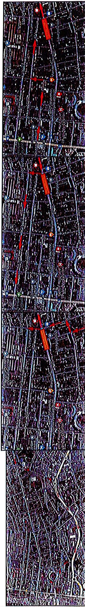
Plan de livraison hôpital