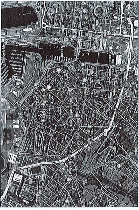
Plan de déviation