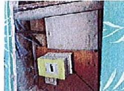
Déconnexion du câble 4x35 Au et confection Bout perdu