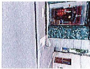
Complage existant du magasin à manœuvre