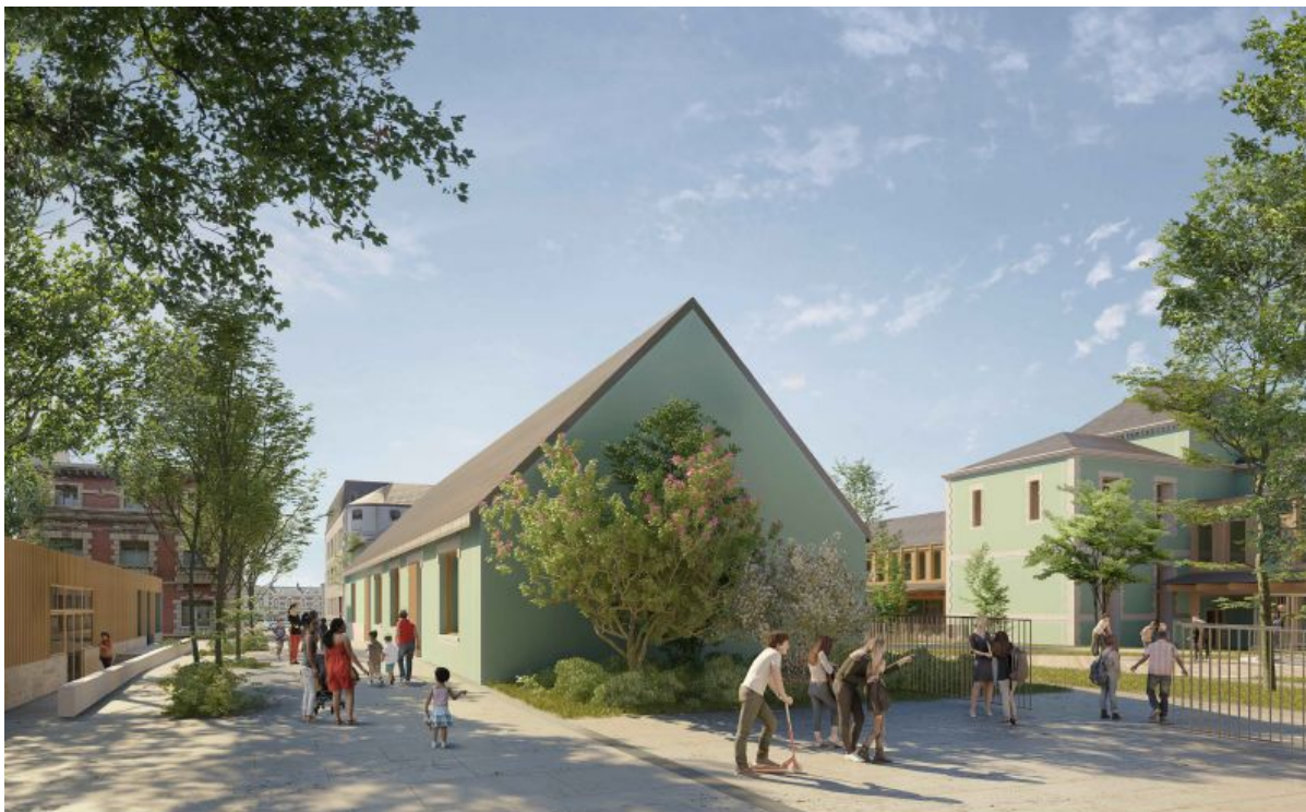
Perspective - nouvelle entrée