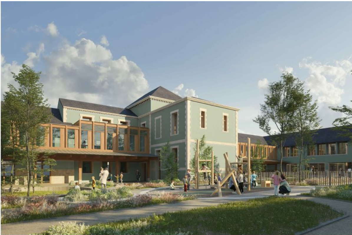
Perspective - la future cour