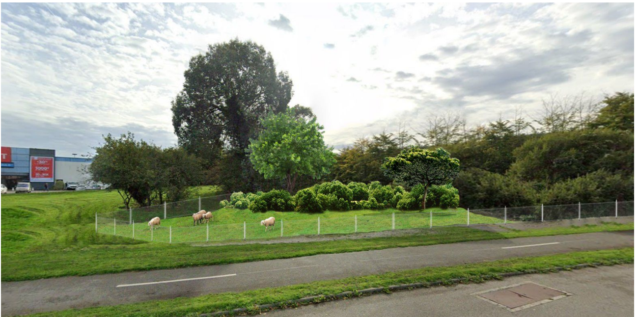
Visuels avant/ après