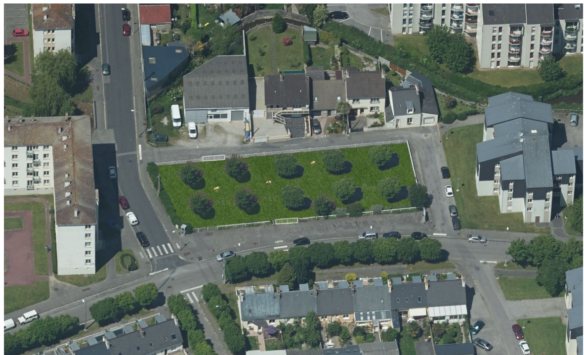
Visuels avant/ après

Sur le site de l'ancienne SPA, l'ensemble du bâtiment sera également curé, désamianté puis démolé. L'ensemble des dalles, fondations, réseaux seront retirés. Le site sera également décaissé sur 20cm pour pouvoir le végétaliser (terre végétale sur 20 cm). La plantation d'arbres sur le site et sur les abords est envisagée. Les arbres existants sur le site seront conservés, dès que possible, notamment : les eucalyptus qui se trouvent en bordure de parcelle.