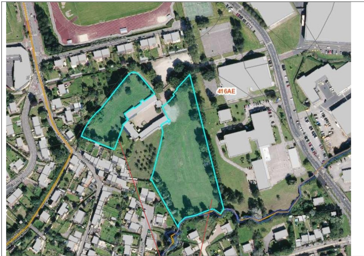
Parcelle 416AE 20 - 243